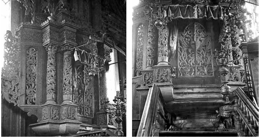
Фрагменты интерьера синагоги Кельма

Рав Исраэль посоветовал ему в первую очередь заняться исследованием качеств души, «и до сих пор, – говорил рав Симха Зиссель своим ученикам, – я продолжаю эту работу». В Доме Учения Невайзер он последовал за Учением Мусар и стал одним из самых близких учеников рава Салантера, благодаря чему умножил свое знание Торы и продвинулся в постижении мудрости.