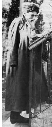
Рав Ицхак Блазер (рав Ицэле Петербургер)