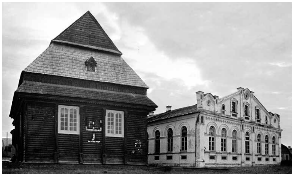
Деревянная и каменная синагоги Кельма