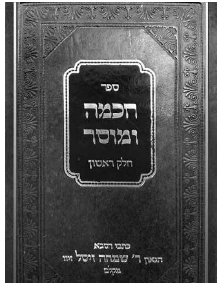
Современное издание на иврите книги «Мусар Дома Учения в Кельме»