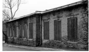
Здание ешивы Тельз (Тяльшай)

Рассказывают, что однажды на этой станции оказался известный праведник рав Мендель из Таврига (Таураге), и когда ему сказали, что эта женщина – жена рава Исраэля Бройде, он оказал ей большое почтение. Однажды один из путников увидел с каким уважением к ней относятся