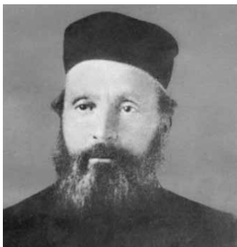
Рав Элиезер Гордон – раввин и глава ешивы Тельз (Тяльшай)

вание о раве Симхе Зисселе рав Салантер нередко завершал изречением царя Шломо из Песни Песней, в форме притчи повествующей об отношении Творца мира к народу Израиля: «Вся ты прекрасна, моя подруга, и нет в тебе изъяна» 6 . Основатель Учения Мусар относился к Сабе из Кельма с особым почтением и возлагал на него решение самых важных и актуальных задач, стоявших в тот исторический период перед Общиной Израиля, считая его единственным, кто мог с этим справиться.