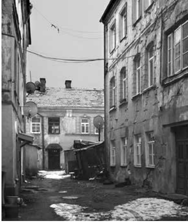
Двор в бывшем еврейском квартале Вильны

и утонченного понимания, пользуясь множеством первоисточников. После ночной учебы к утру на его столе скапливались стопки фолиантов. Он стремился постичь каждую тему, начиная с изучения Талмуда, Первых и Последних комментаторов и законоучителей и завершая практическим выведением закона. Уроки раввина по Мусару отличались глубиной мышления и логикой.