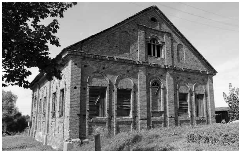
Старая синагога Чекишек (Чекишкес)