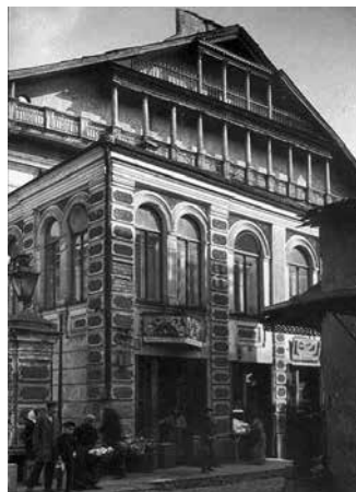
Большая синагога Вильны

Согласно пути рава Исраэля Салантера, рав Симха Зиссель, помимо углубленного изучения книг Мусара, всю жизнь с восхищением и воодушевлением повторял изречения мудрости. Он посвящал этому продолжительные и четко установленные промежутки времени, в чем видел основу своего служения в духе Мусара. Рассказывают, что на протяжении шести лет он занимался изучением третьей главы книги рабейну Йоны из Герунди «Шаарей тшува» – «Врата раскаяния» – раскрывающей сокровенную суть предписывающих и запрещающих заповедей. Однажды рав Исраэль сказал раву Симхе Зисселю, что тот столь многого достиг в своей духовной работе, что больше не нуждается в изучении Мусара. Эти слова привели рава Бройде в ужас, и он долго размышлял, следует ли ему в этом вопросе последовать мнению своего раввина. Спустя некоторое время рав Салантер заметил, что раву Бройде будет достаточно изучать Мусар по три часа в день. И это замечание учителя вернуло ему покой души.