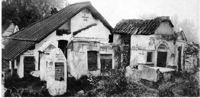
Могила Виленского Гаона на старом кладбище Вильны Сனிпішкес (Шнипишкес)

люди и пожертвовал ей три рубля – крупную по тем временам сумму денег. Вместе с радостью, вызванной щедрой помощью нуждающимся, рабанит испытала столь сильное страдание из-за оказанного ей почета, что даже заплакала.