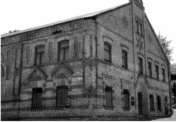
Старая синагога Алитуса

них поколений. Во всем происходящем он в первую очередь старался обнаружить центральный принцип правления Всевышнего «мера за меру», в чем видел суть Б-жественного Провидения.