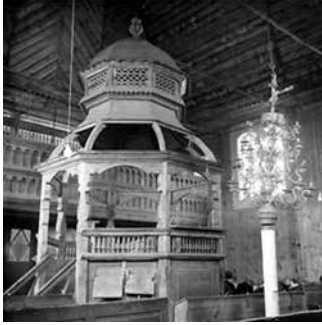
Бима синагоги Кельма