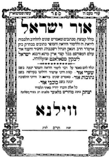
Книга Свет Израиля рава Исраэля Салантера