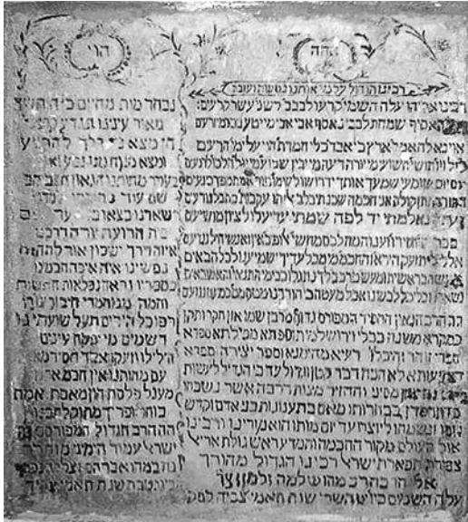
Надпись на надгробии Виленского Гаона