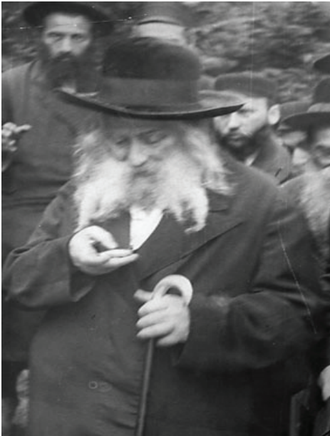
Адмор из Гур, автор книги «Имрей Эмет»

Стремление к почету обычно присуще тому, кто сам не находит в себе ничего стоящего и чувствует, что не достиг никакой духовной высоты. Такой человек нуждается в почестях, которые окажут ему люди, ему нужно, чтобы его считали важным, и тогда он ощущает себя комфортно, почести буквально оживляют его. Однако тот, кто достиг определенного духовного уровня и осознает это, совершенно не нуждается в почестях, он радуется тем достоинствам, которые развил в себе, и именно благодаря им он чувствует себя значимым. Такой человек равнодушен к почестям, и даже если ему станут их оказывать, он не почувствует удовольствия.