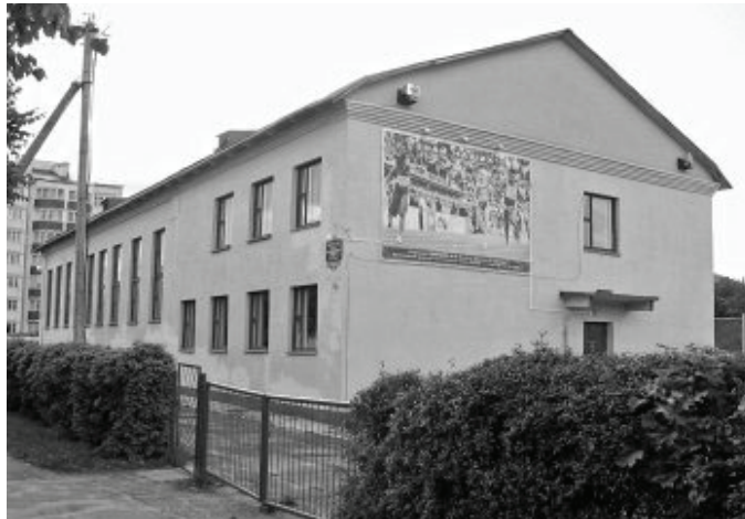
Ешива в Барановичах в наши дни

Лавка «берлинца» закрылась через пару недель. Праведные евреи Барановичей не желали иметь дел с нарушителем Субботы, к тому же публично оскорбившим мудрецов Торы. «Берлинец» разорился и, преследуемый кредиторами, сбежал из города.