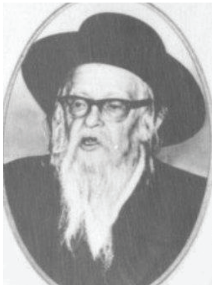
Гаон из Чебина

– А вы что говорите? – возмутился молочник, – какой же я бедняк? Ведь у меня, слава Б-гу, есть дом, и каждый день я могу себе позволить съесть кусочек хлеба утром и кусочек – вечером, и соль, и вода есть у меня,