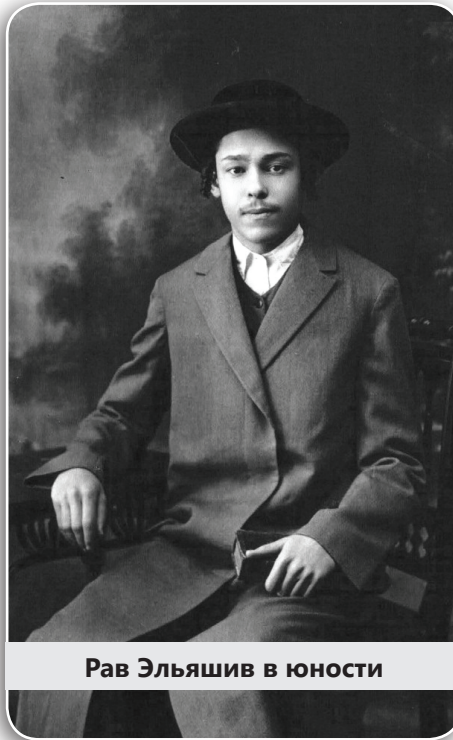
Рав Эльяшив в юности

У рава Йосефа-Шалом были особые отношения с великим дедом. Он был единственным внуком Лешема, которому было позволено помогать и участвовать в учебе каббалиста. Лешем отдавал должное способностям внука, тогда двенадцатилетнего мальчика, он называл его «ребенком, обладающим