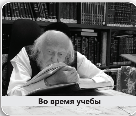
Во время учебы