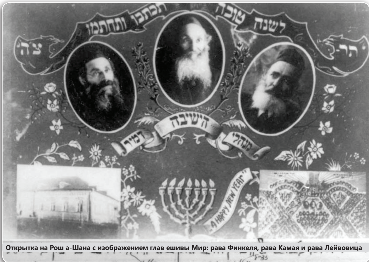
Открытка на Рош а-Шана с изображением глав ешивы Мир: рава Финкеля, рава Камая и рава Лейвовица

В другом эпизоде он сказал, что всякий, кто ведет себя не в соответствии с той степенью, на