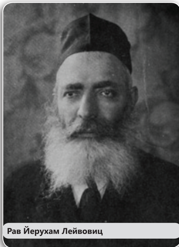
Рав Йерухам Лейвовиц