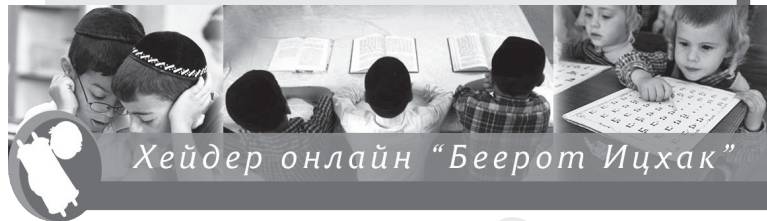
Хейдер онлайн "Беерот Ицхак"