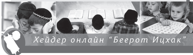
Хейдер онлайн "Беерот Ицхак"