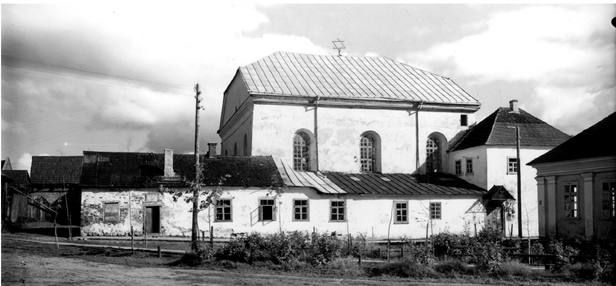
Большая синагога в Новогрудке. около 1930 г. 204E09

На самом деле, отстраниться от этого мира и ограничиться своим особым пространством, предаваясь всем сердцем и всеми чувствами поиску цельности, не так уж трудно. И нечего бояться не удержаться на этой ступени. Если мы посмотрим на поведение человека, пытаюсь разобраться, в чем же его ошибка и в вопросах Торы, и в вопросах повседневной жизни, где же источник духовного и материального падения, то заметим парадоксальную вещь. Казалось бы, где человек может споткнуться? В бездумных вопросах, лишенных всякой логики и личного мнения. Но нет. Оказывается, там еще можно выдержать испыта-