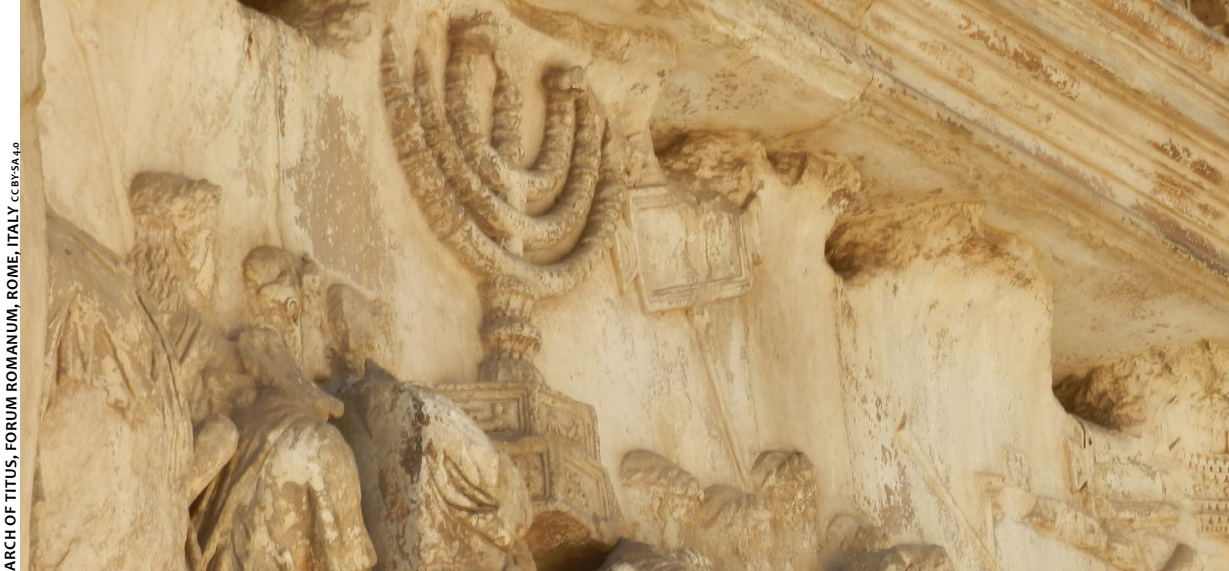
ARCH OF TITUS, FORUM ROMANUM, ROME, ITALY. СБВ5А49

Уважаемые раввины, мы недавно побывали на экскурсии в Риме и видели там Триумфальную арку Тита. На ней есть изображение Меноры из Иерусалимского Храма. В связи с этим у нас возник вопрос: как должна выглядеть настоящая Менора и соответствует ли это изображению на триумфальной арке Тита в Риме? N.