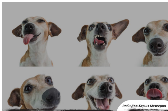
Раби Дов-Бер из Межерич

VK Telegram Facebook Instagram @toldot.ru